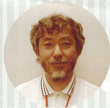
仙台往診クリニック院長